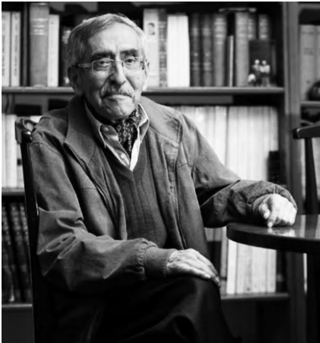
Edgardo Rivera Martínez

Edgardo Rivera Martínez (Jauja, 28 de septiembre de 1933-Lima, 5 de octubre de 2018) fue escritor y docente universitario peruano. Sus obras literarias más importantes son el cuento Ángel de Ocongate (1986) y la novela País de Jauja (1993), esta última considerada por los críticos como la mejor de la literatura peruana de los últimos tiempos. Es también autor de numerosos trabajos de investigación, particularmente sobre viajeros y literatura de viajes en Perú.